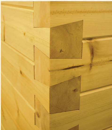
Angles en queue d'aronde